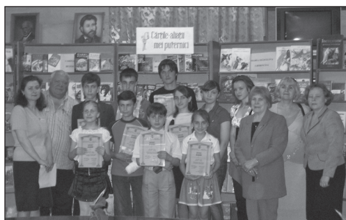
Cu premianții și membrii juriului Concursului „Cititor-model”