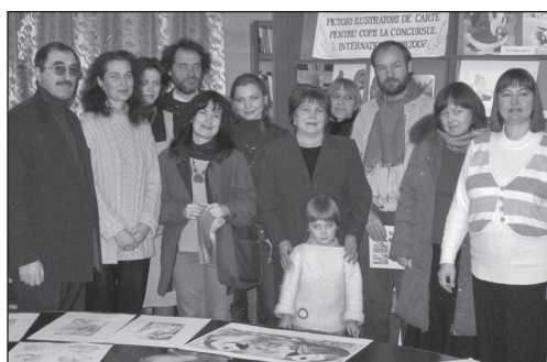
Cu pictorii din Republica Moldova, participanți la Bienala de Ilustrații de Carte pentru Copii BIB din Bratislava