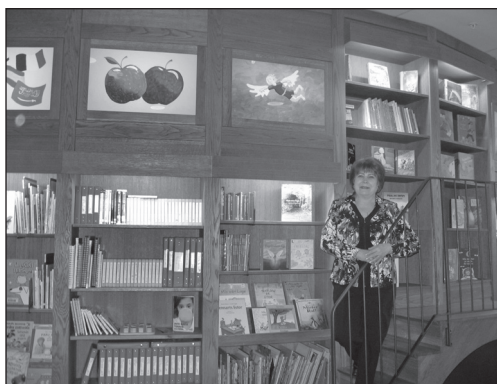
În Biblioteca pentru Copii (Rum för Barn) din Stockholm