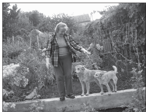
Florile aducătoare de frumusețe și liniște sufletească