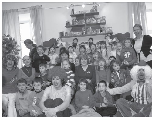
Printre cititori și clovnii-bibliotecari după inaugurarea Bibliotecii Picilor