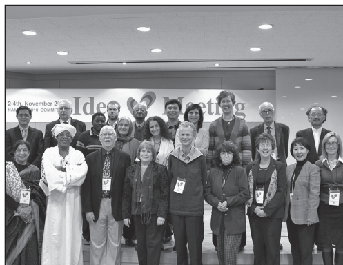
Comitetul organizatoric al Festivalului NAMBOOK010 din Coreea de Sud, după ședința dedicată Proiectului „Peace Story”