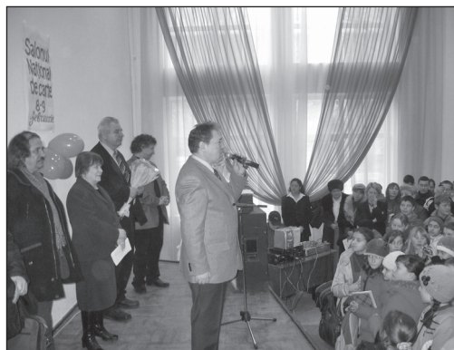
Salonul de Carte pentru Copii la Cahul în cadrul Proiectului „Spre cultură și civilizație prin lectură”