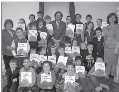
După lansarea cărții „Lumea ca o poveste” de Arcadie Suceveanu