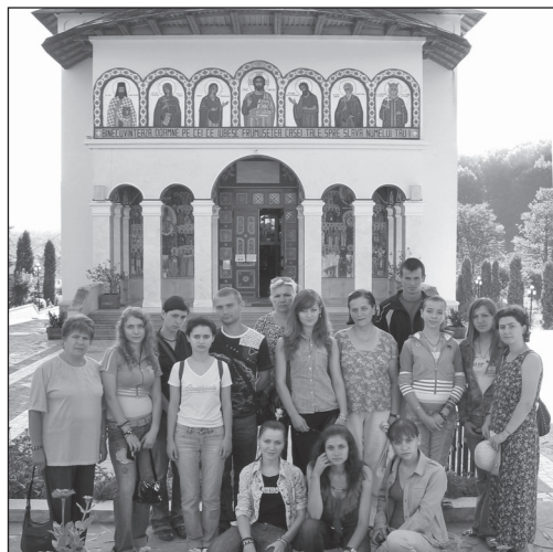
La mănăstirea Sihăstria din România cu premianții Concursului „La izvoarele înțelepciunii”