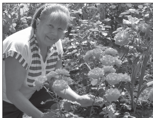
Prietenii și paznicii cei mai siguri la casa de vacanță Balaban