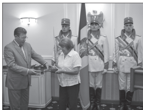
La ceremonia de primire a Ordinului de Onoare, înmănat de Mihai Ghimpu, Președinte interimar al Republicii Moldova