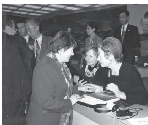
În discuție cu Maiestatea sa împărăteasa Japoniei Michiko la Congresul IBBY în Basel, Elveția