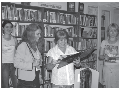
Primind o donație din partea Ambasadei SUA la Chișinău