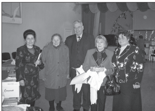
Cu academicianul Mihai Cimpoi la Larga, Briceni